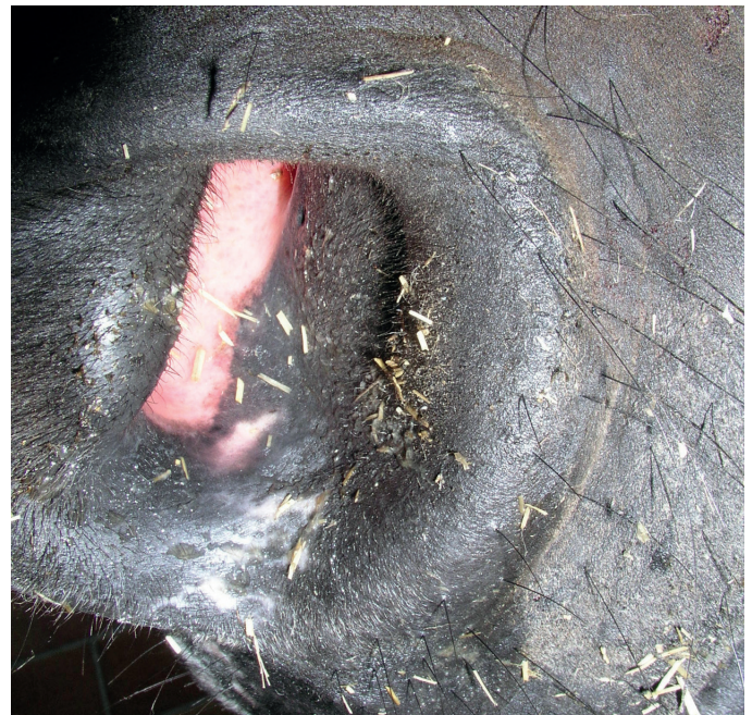
Écoulement nasal en cas de rhinopneumonie liée à l'HVE-1

Le virus peut être excrété pendant une période pouvant aller de 2 à 3 semaines après l'infection ou la réactivation. Dans le cas de l'affection neurologique de l'HVE-1, le virus peut être excrété pendant une période encore plus longue. La survie